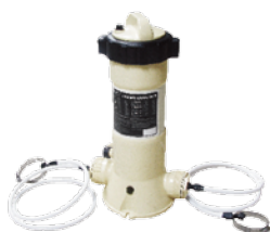
CL-01 & CL-02 (bypass)