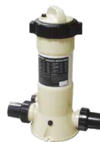
CL-01 & CL-02 (en línea)

La serie "CL" incluye 6 modelos que se diferencian en capacidad y tipo de instalación: montaje directo en la tubería del sistema de filtración (en línea) o conectados en una tubería paralela (bypass).