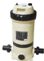
CLL50 & CLL75 (en línea)