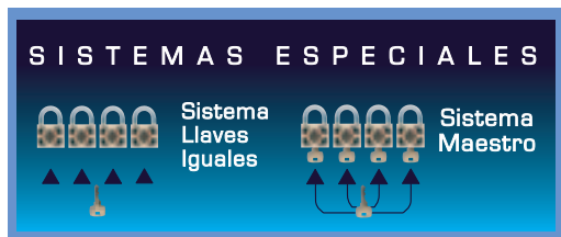
Imagen de igualamiento y amaestramiento