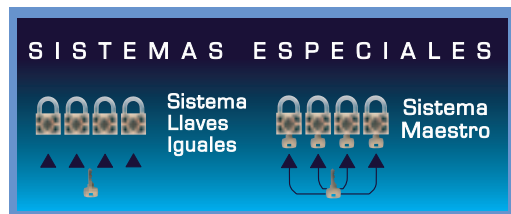
Imagen de igualamiento y amaestramiento